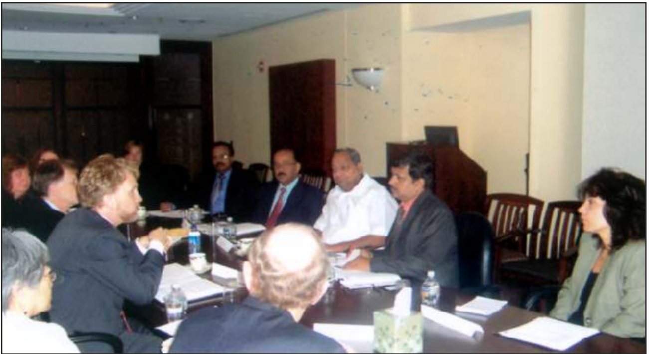
'कारा' और उसके अमेरिकी समकक्षों के बीच परामर्श बैठक