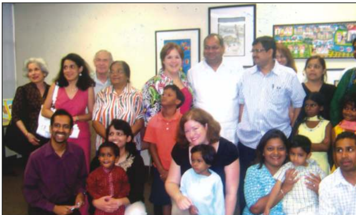
दत्तक ग्रहण करने वाले अमेरिकी माता-पिता और उनके दत्तक बच्चों के साथ 'कारा' के अधिकारी

* पूर्वोत्तर क्षेत्र हेतु 20 लाख रुपए सहित